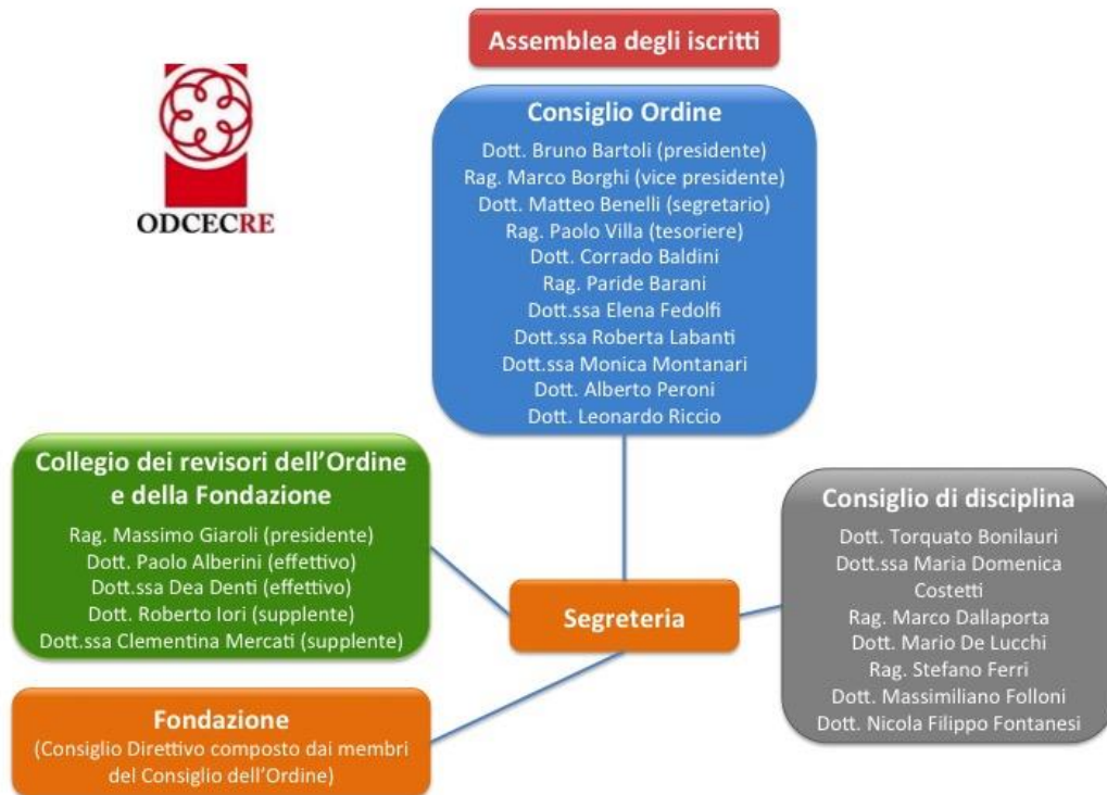
Figura 1 - Organigramma dell'Ordine dei Dottori Commercialisti e degli Esperti Contabili di Reggio Emilia