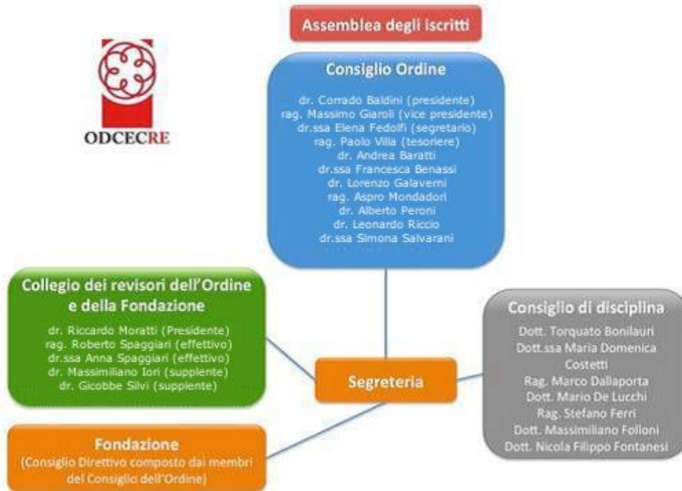
Figura 1 - Organigramma dell'Ordine dei Dottori Commercialisti e degli Esperti Contabili di Reggio Emilia