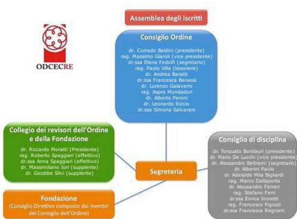
Figura 1 - Organigramma dell'Ordine dei Dottori Commercialisti e degli Esperti Contabili di Reggio Emilia